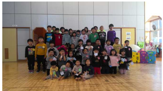
園児たちはお兄さんお姉さんからのプレゼントに大喜びでした。