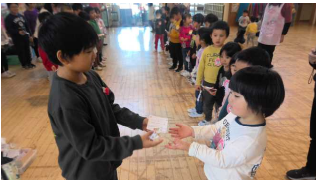
11月26日（火）、若美南保育園を訪問して園児たちにプレゼントしました。