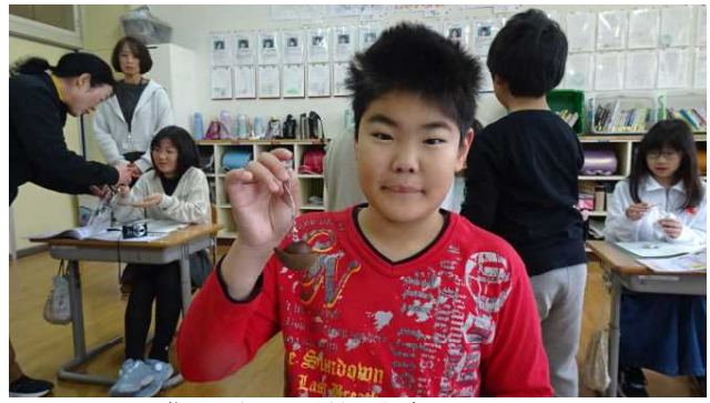
袋から出して手触りを確かめました。