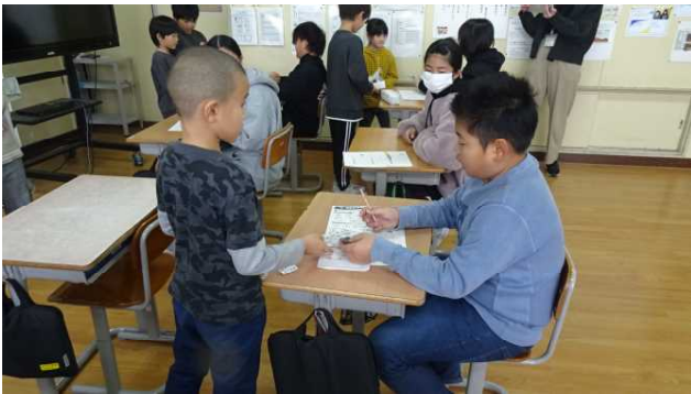
6年生へのプレゼントです。