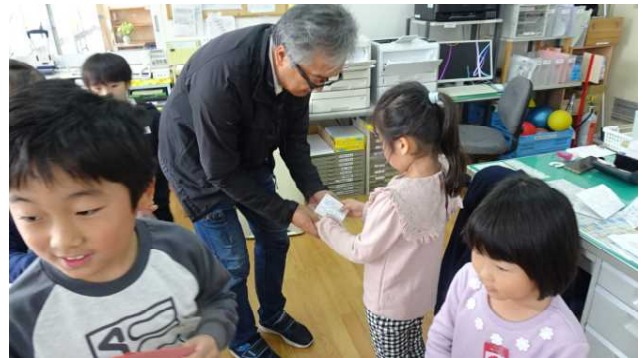
翌11月22日（金）、早速職員室を訪問し、とちの実キーホルダーを先生方にプレゼントしました。