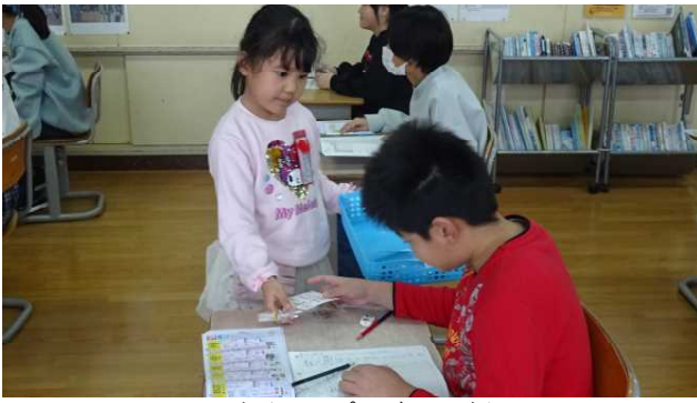
4・5年生へのプレゼントです。