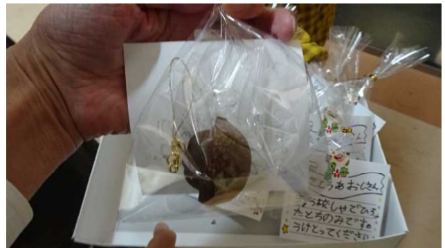
これが1・2年生が作ったとちの実キーホルダーです。袋に入れて一人一人に向けてメッセージカードも作りました。とても心がこもっています。