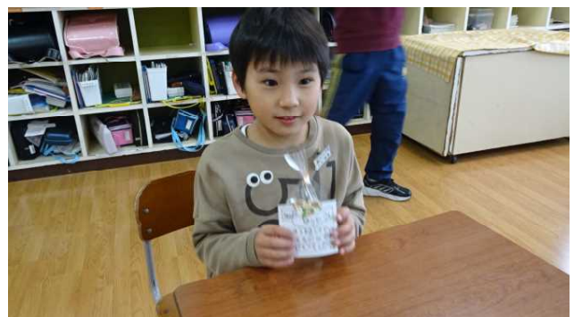
思わず笑顔になる3年生。