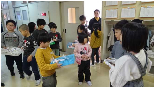
1・2年生がペアを組んでこれからプレゼント作戦を実行します。