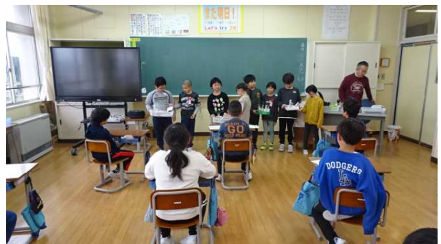
3年生の教室にお邪魔してプレゼント作戦について説明しました。