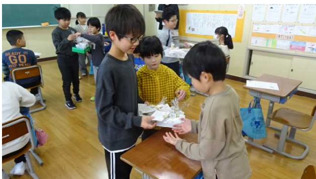
3年生へのプレゼントです。