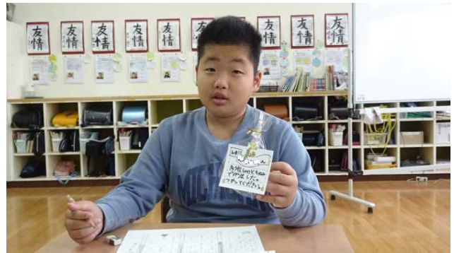
これまでいろいろお世話してきた1・2年生からの突然のプレゼントに驚いていました。