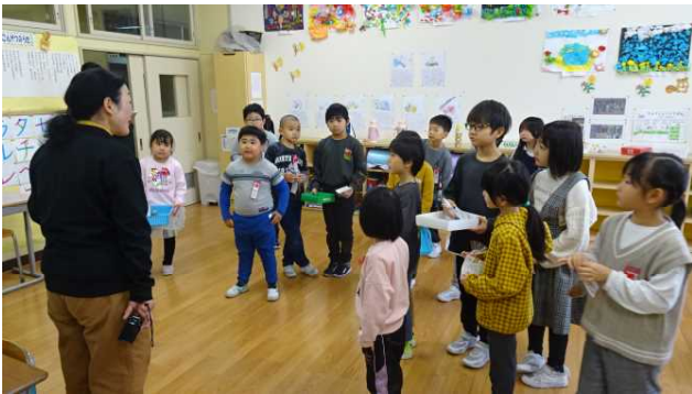
教室に戻ってきた1・2年生ですが、学校の先生方や若美南保育園の園児たちにもプレゼントしたいという声が集まり、追加して作ることにしました。